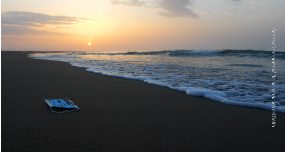
Centre d'interpretació de les barraques del Delta

El temporal Glòria va destruir bona part de la costa del Delta amb afectacions importants a escala local, en canvi la pandèmia pel Coronavirus no ha estat tan severa al sud de Catalunya com en altres territoris i països. Aquesta peça vol reflexionar sobre el futur individual però també col·lectiu, especialment en un món globalitzat. Així, mitjançant la metàfora visual mostra la contraposició entre el local i el global i posa de manifest el conflicte d'interessos entre l'individual i el col·lectiu.