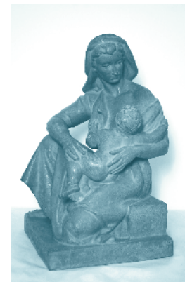
Maternitat Innocenci Soriano-Montagut, 1949

En parlar de les Medalles d'Art de la ciutat no es pot obviar, però, la importància de dos noms propis. El del crític, promotor d'art i col·leccionista Maties Ballester Cairat (1915-1977?) -fundador l'any 1955 a la nostra ciutat de l'efímer Museu Ballester d'Art Contemporani- com a impulsor de la creació d'aquests premis, dels quals va ser guanyador i jurat en diferents edicions; i el de Francesc González Cirer (1911-2003), catedràtic d'institut que es dedicà amb passió a la crítica de l'art a través de publicacions com Gèminis , Bajo Ebro , La Zuda , La Voz del Bajo Ebro o Diario Español , resseguint l'activitat artística a la ciutat. Com a tal ens ha transmès la crònica de les Medalles fins als nostres dies.